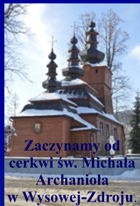
Zaczynamy od cerkwi św. Michała Archaniola w Wysowej-Zdroju.

Mając już niewielką wiedzę o miejscu naszego spaceru, chcemy zaprosić Was na trasę.